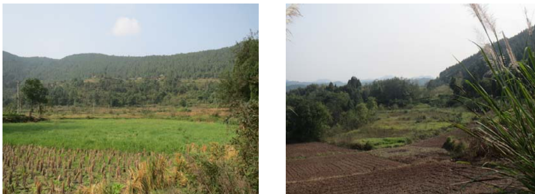
图 3-3 项目区地形地貌

磨溪 022-H8 井场范围内地形起伏呈宽缓台阶状，北高南低，井场范围内高程介于 318.8m~321.8m，相对高差近 3m。（见图 3-3 项目区地形地貌）