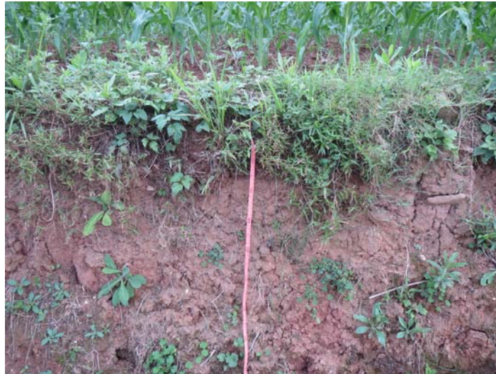
图 3-4 耕地土壤剖面图

土壤剖面从上而下大体可分为：表土层，厚度约在 30cm 左右；心土层，位于表土层以下，厚度约为 30-40cm；底土层，一般位于土体表面 50-60cm 以下的深度，此层植物根系分布较少。现场土壤剖面表土层和心土层分层不明显。