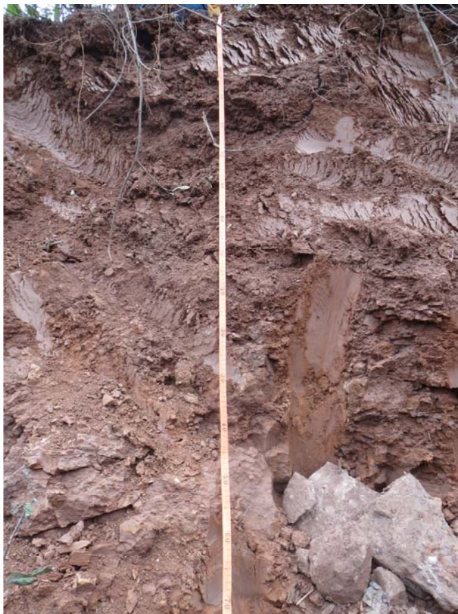
图 3-5 林地土壤剖面图