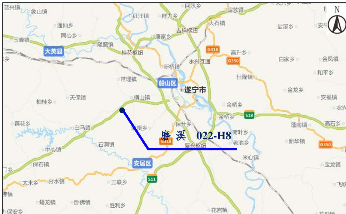
图 3-2 项目地理位置示意图